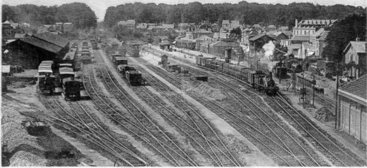
23. - Flers. — La Gare