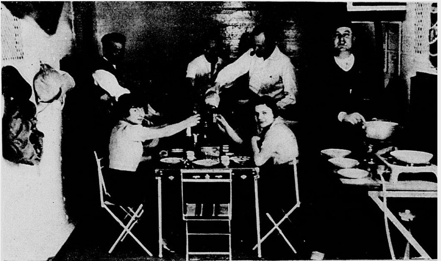
Le premier repas est toujours joyeux et plein d'entrain.