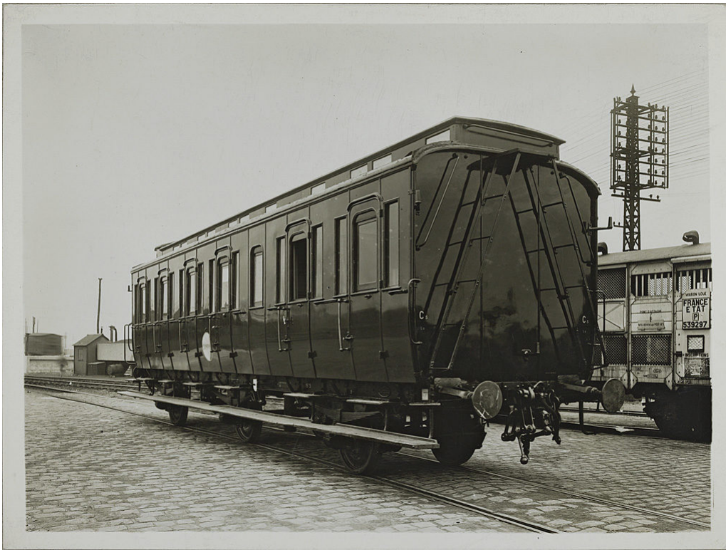
Voiture Camping – CF de l'Etat

Le dortoir comporte 10 couchettes. Le réfectoire comprend une table, un banc, un tabouret, une desserte et 2 couchettes d'appoint