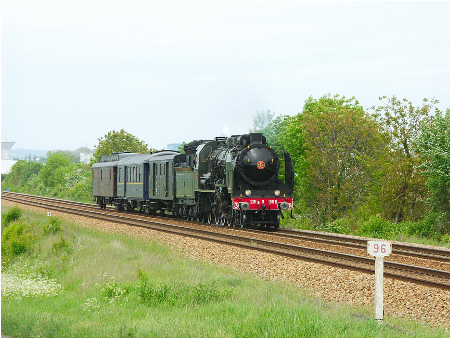
231 G 558 – Argentan – 17/05/2006

Mais les premières à circuler sur l'Ouest furent les 2901/2902 Ouest, qui devinrent 6001/6002, puis 231-001/002 Etat.